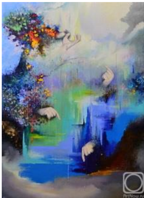
художник Вадим Столяров