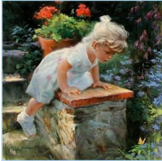
художник Владимир Волегов