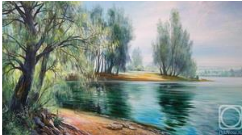
художник Ильдус Муртазин