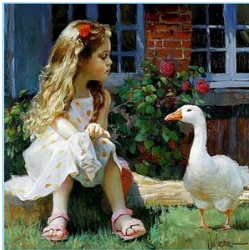
художник Владимир Волегов

Алиса сидит у крыльца – ну сколько же можно ждать? – Весь белый день пролетел, сидеть давно надоело. Девчонка морщит свой носик: – Какая-то ерунда! Я что, неужели напрасно белое платье надела?!