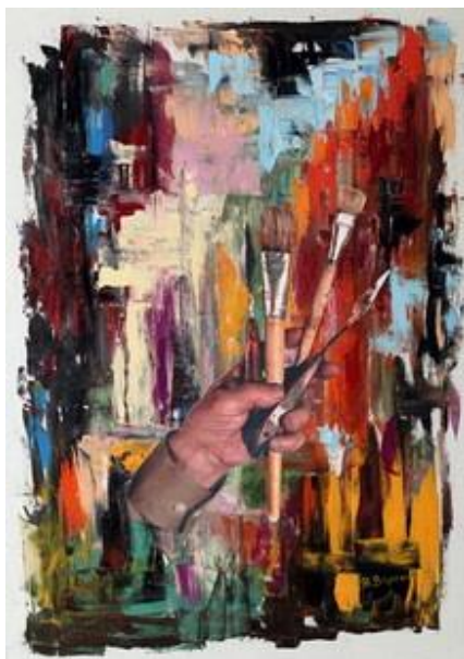
художник Владимир Волосов