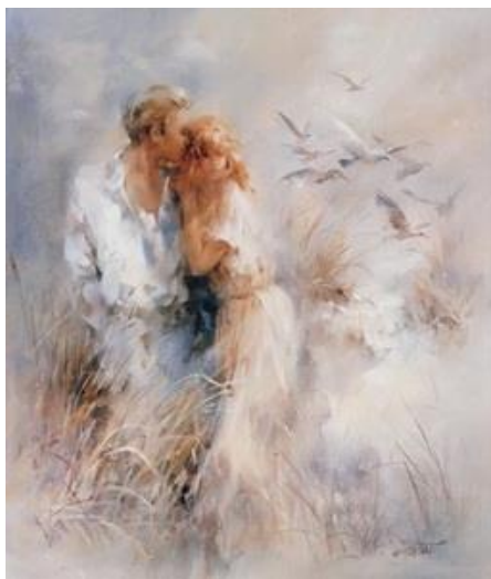
художник Willem Haenraets