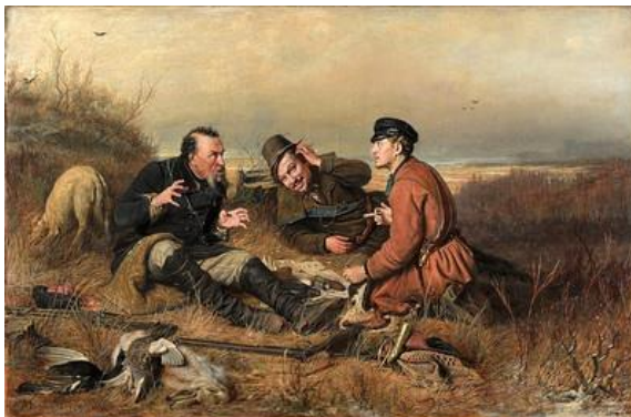
В. Г. Перов. Охотники на привале

20 Василий Григорьевич наскоро позавтракал и с воодушевлением поднялся в мастерскую. Льняные солнечные лучи, изредка выбегая из-за туч, освещали на короткое время невысокое скромное помещение, из окон которого можно было увидеть провинциальный московский дворик с оголившимися деревьями и кустарниками. Художник подошел к мольберту, отодвинул его от прямого естественного света, снял холщовую тряпицу с подрамника и сделал несколько шагов назад, чтобы свежим взглядом оценить законченный накануне холст, напряженная работа над которым прибавила бодрости и сил и дала немного удовольствия и отдыха сердцу, отяжелевшему в последние годы от семейных горестей, болезней и смертей.